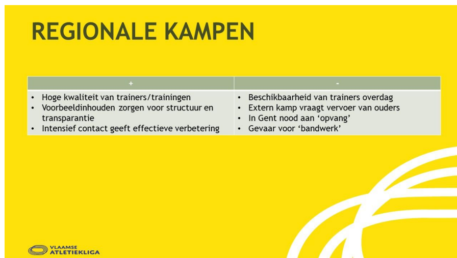
Figuur 2 overzicht van de positieve punten en de werkpunten van de regionale kampen na een analyse na de eerste 3 reeksen van kampen