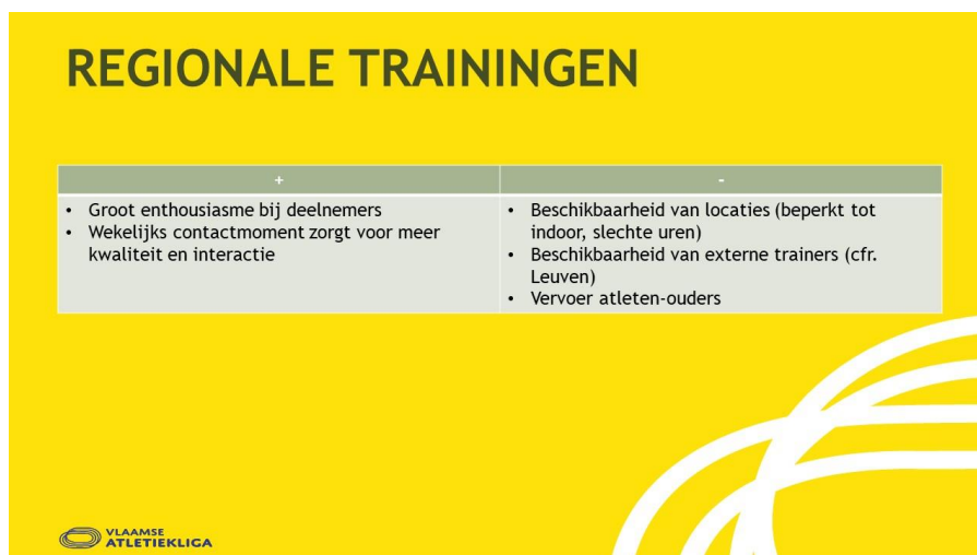
Figuur 4: overzicht van de positieve punten en de werkpunten van de regionale trainingen na een analyse na de eerste reeks trainingen.