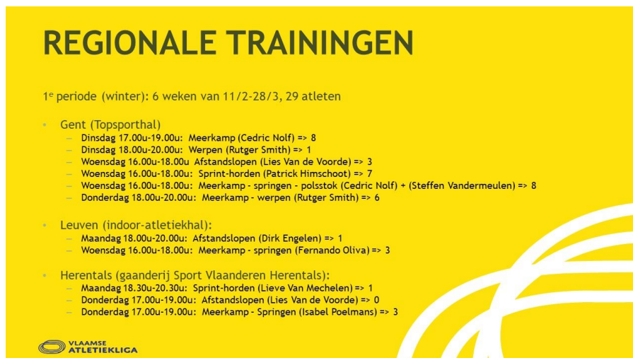
Figuur 3: overzicht van de georganiseerde regionale trainingen in de periode februari-maart