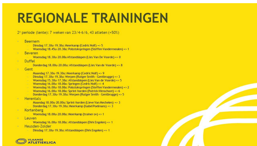
Figuur 5: overzicht van de georganiseerde trainingen in de komende periode