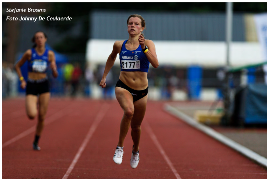
Stefanie Brosens

Roos Vanden Berghe/DUFF (goud kogel met 13m20, goud speer met 35m22, zilver 100m horden in 15"06 scholieren): "In de opwarming van het speer en bij de eerste worpen moest ik even wat zoeken. Maar naarmate de wedstrijd vorderde, ging het beter. In het begin liep ik wat te traag aan. Bij de laatste worpen had ik iets meer agressiviteit en dat hielp. Ik bleef een meter onder mijn record. In het kogelstoten wilde ik heel graag nog de 13 meter halen dit seizoen. Eerst zag het er naar uit dat het niet zou lukken. Maar op het einde heb ik toch nog twee hele verre worpen gedaan en daar was ik blij om. Ik ben op twee maanden tijd twee meter vooruitgegaan in het kogelstoten. Dat heb ik te danken aan