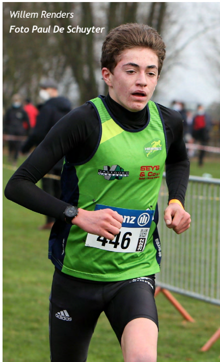
Willem Renders