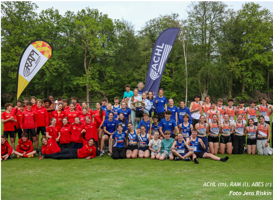
ACHL (m), RAM (l), ABES (r)

De accommodatie, tribune en de atletiekpiste van Ac Break in Brasschaat kregen twee jaar geleden een flinke opwaardering. Het was het perfecte decor voor de interclub in Landelijke 2B. De organisatie liep op roletjes. Afgezien van een kleine vertraging vlak voor de afsluitende estafette (gebeurt wel vaker bij een BVV) viel er niets op af te dingen.