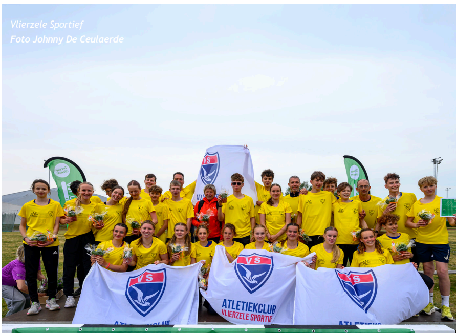
Vlierzele Sportief

De Beker van Vlaanderen is voor cadetten en scholieren traditioneel een van de hoogtepunten van het seizoen: de dag waarop de clubkleuren als streepjes op de wangen verschijnen, de vlaggen worden ontrolt en iedereen samen strijdt voor een zo hoog mogelijk clubklassement. Ondanks de stormachtige wind en de kille temperaturen werden er knappe prestaties geleverd, al kwamen die niet altijd volledig tot hun recht. Sprinters kregen tot bijna 5 m/s tegenwind te verwerken en ook de kampers moesten zoeken naar ritme. Collectief stak Vlierzele Sportief er met kop en schouders bovenuit. Aanvankelijk moest de club nog AZW voor zich dulden, maar tegen de middag namen de Oost-Vlamingen de leiding over om die nadien alleen maar verder uit te bouwen. Nog voor de afsluitende estafettes stond vast dat de overwinning binnen was. Met 413,5 punten deed VS liefst 41 punten beter dan AZW (372,5), dat dankzij sterke estafettes nog AC Lebbeke (363,5) voorbijstak. Onderaan kon ACW (229) een tweede opeenvolgende degradatie niet vermijden. HCO, dat met 221,5 punten laatste werd, zakt mee naar Landelijke 3.