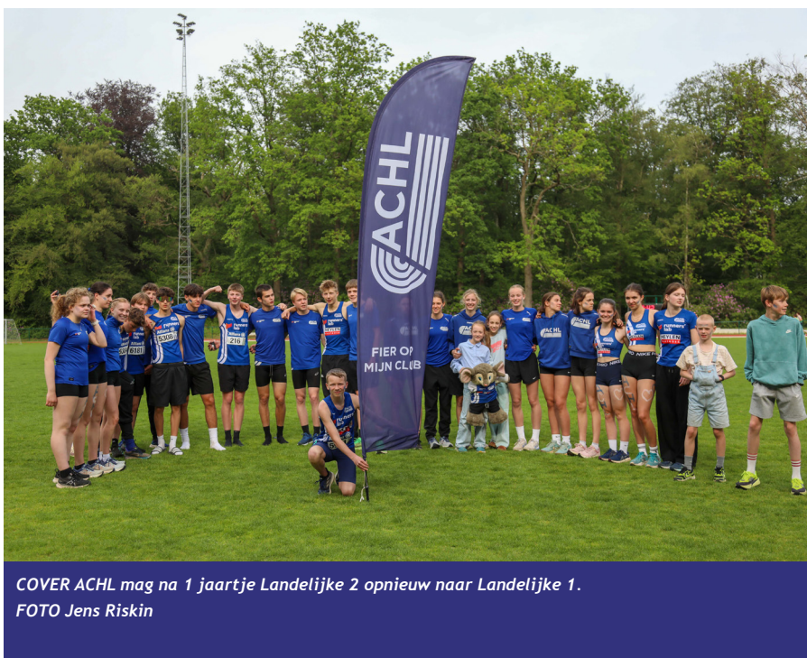
COVER ACHL mag na 1 jaartje Landelijke 2 opnieuw naar Landelijke 1.

Arendonk. Vorig jaar degradeerde de club en ze wilden duidelijk iets rechtzetten. Vanaf de eerste tussenstanden namen ze de leiding om die niet meer af te staan. De strijd om de tweede felbegeerde promotieplek bleef spannend tot de estafettefinale.