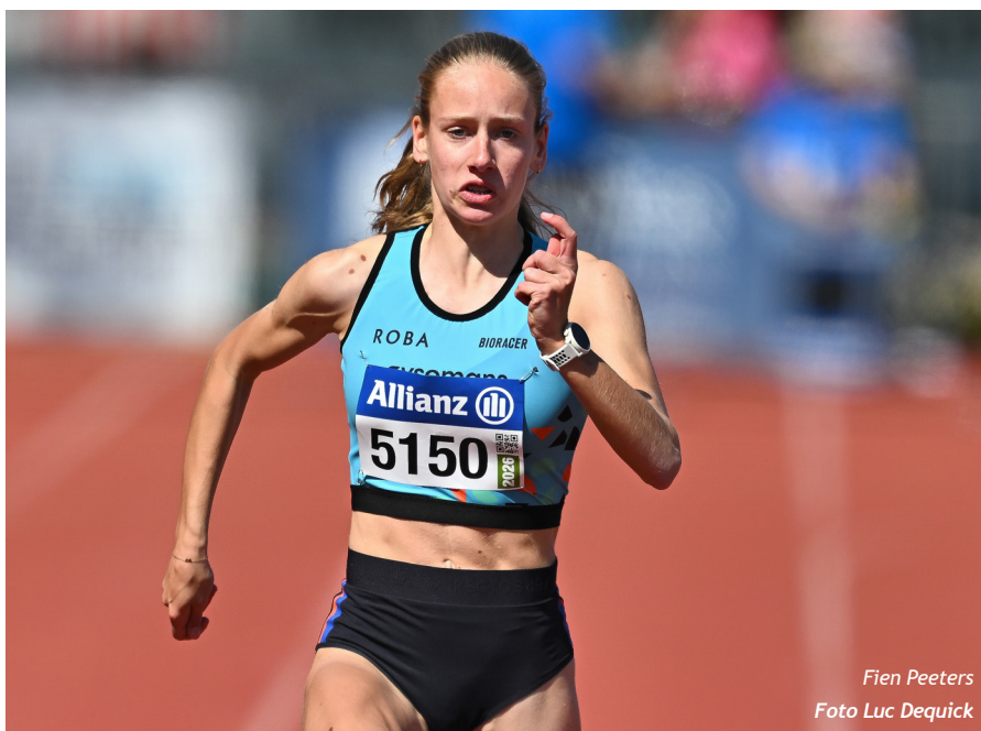
Fien Peeters

De hordewedstrijden waren ietsje minder bezet dan de voorbije edities, maar dat viel ook op in de andere provincies. Met slechts