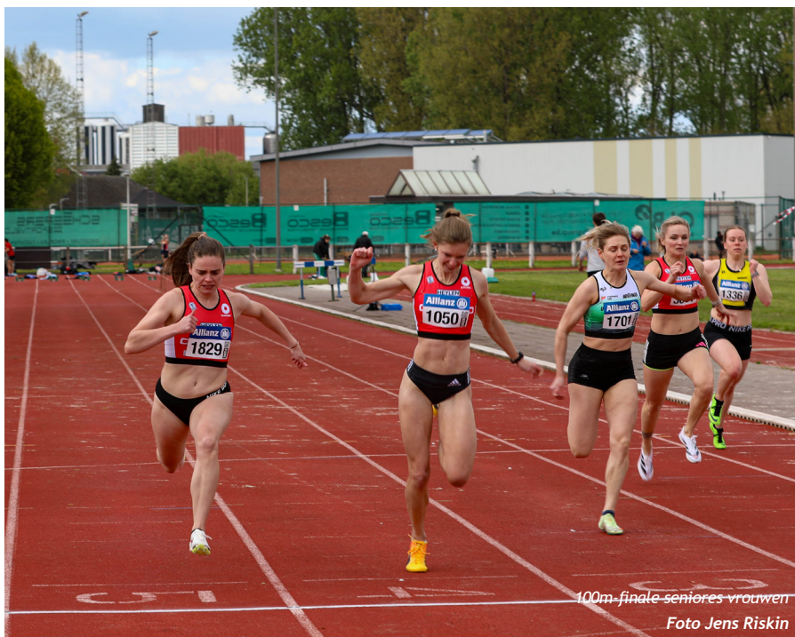
100m-finale seniores vrouwen