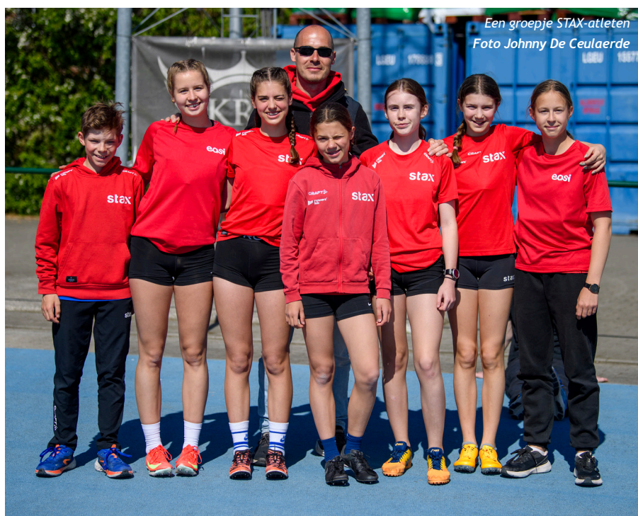
Een groepje STAX-atleten