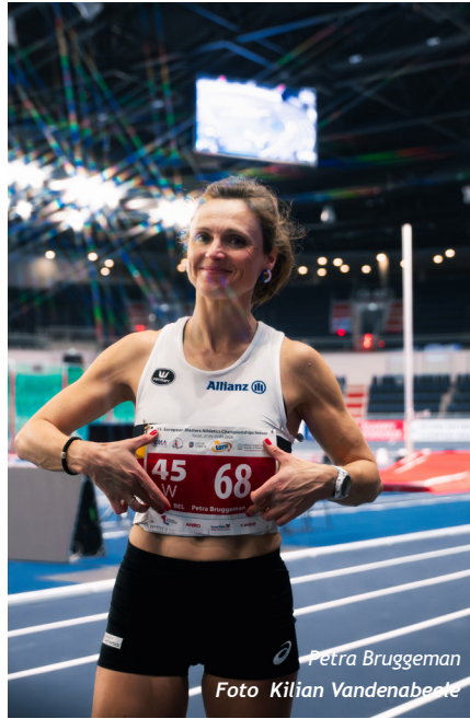
Petra Bruggeman

Pieter Berben mag stilaan het ereburgerschap van de stad Torun ambiëren. In 2023 werd hij hier wereldkampioen veldlopen en een jaar later voegde hij op dezelfde plaats de Europese titels in het veldlopen en de 3000m indoor aan toe. Hij kende zowat elke hellingsgraad van het bijzonder heuvelende veldloopparkoers en elke vierkante centimeter van het blauwe ind-