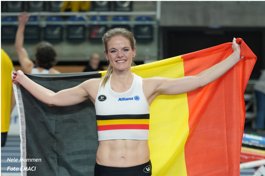
Nele Mommen