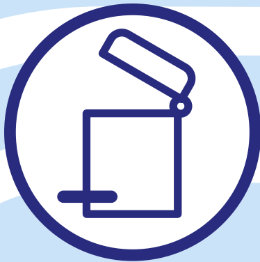
Afsluitbare vuilnisbak (bij voorkeur pedaalemmer) met plastic zak erin