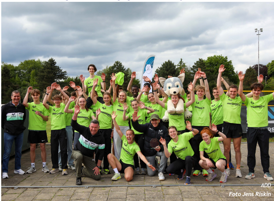
ADD Foto Jens Riskin

In de tussenstanden stond al snel vast dat de Beker-confrontatie in 2B zou uitdraaien op een driestrijd tussen TUAC, TACT en ADD. TACT wist bijzonder veel punten te sprokkelen in de werpnummers en behield lange tijd de leiding. ADD kon dan weer een zeer gunstig rapport voorleggen in de langere loopproeven. Het meerkamperichte TUAC was op alle fronten degelijk en kon zo lang meestrijden om de knikkers. Vlak voor het ingaan van de beslissende estafeteproeven stond ADD in polepositie. Toen zowel TUAC als TACT tegen een diskwalificatie aanliepen, kon het haast niet meer misgaan. ADD greep de winst met 226.5 punten, voor TACT (214.5 punten) en TUAC (205.5 punten). Maar de strijd was een pak spannender dan de uitslag op papier doet vermoeden. GENK wist zich in extremis nog te redden nadat het ex aequo vierde eindigde op 203 punten met thuisclub VMOL, maar de betere estafette deed de balans doorslaan in het voordeel van de Genkenaars. De overige ploegen VMOL, RAM, AVZK, ESAK en BRABO, SPVI en ACKO zullen volgend jaar opnieuw Landelijke 3 opvullen. Zodat de laagste afdeling weer goed gevuld is.