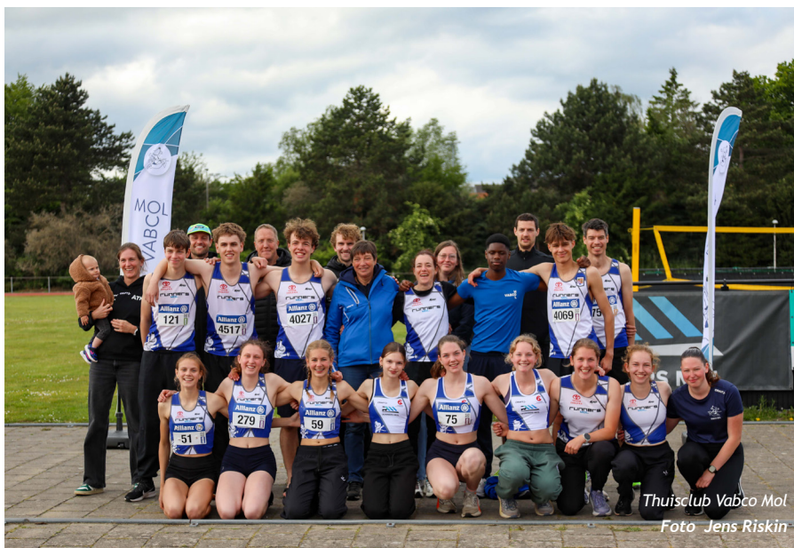
Thuisclub Vabco Mol

De vijf clubs in Landelijke 3 betwistten hun BVV in Arendonk. De rode brigade van Hopland zal zich de verre verplaatsing niet beklagen. Zij prijkten na een middagje ‘bekeren’ op de eerste plaats dankzij onder