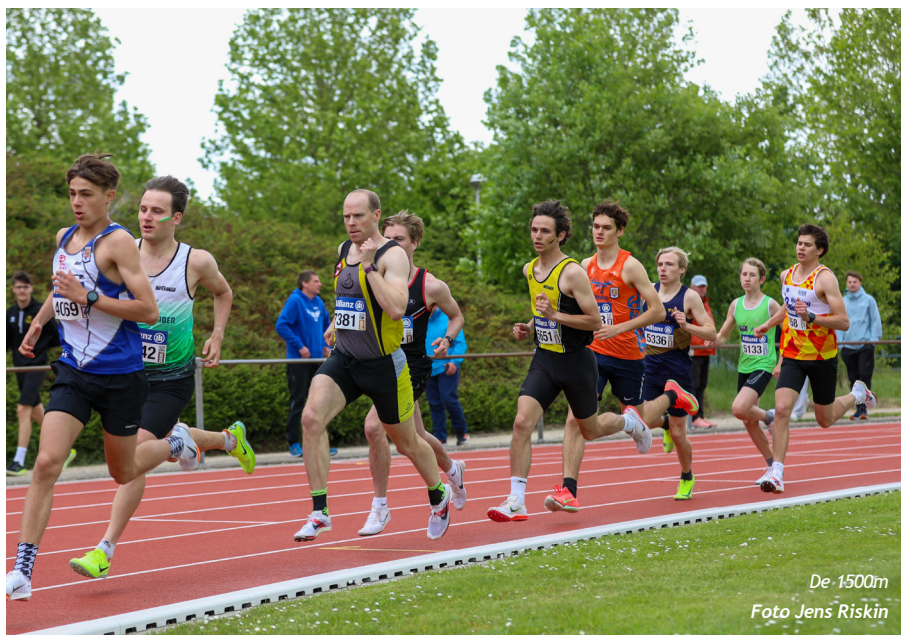
De 1500m