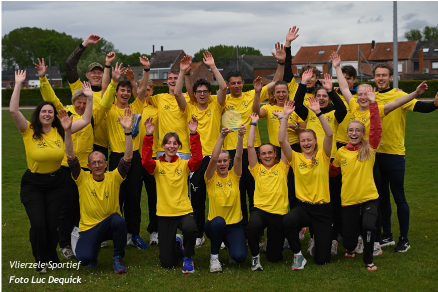
Vlierzele Sportief

Met een klinkende overwinning heeft Vlierzele Sportief zich zondag in Lebbeke verzekerd van promotie naar de nationale First League. VS was in de ere-afdeling een klasse apart en hield uiteindelijk ruim twintig punten voorsprong over op ROBA. ACW vervulde het podium, op amper een half puntje van ROBA, terwijl AVT en AZW afscheid moeten nemen van het hoogste Vlaamse niveau.