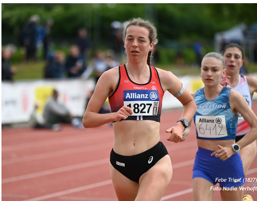
Febe Triest (1827)