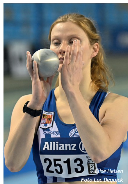
Lise Helsens