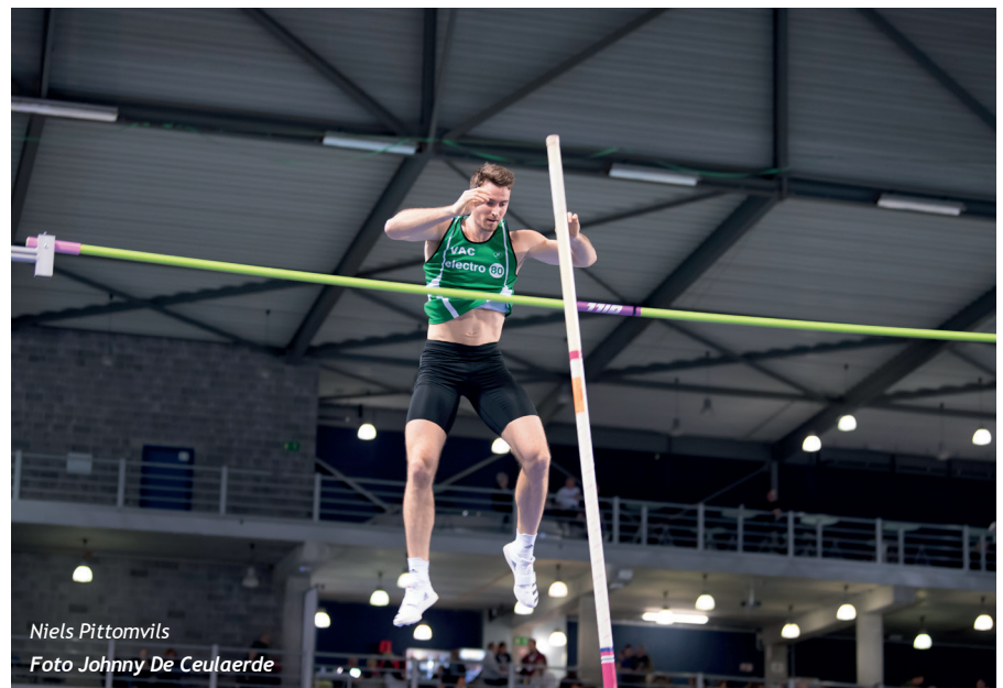
Niels Pittomvils

wat individueel niet eenvoudig zal zijn. Maar met de Falcons kunnen we daar wel iets mooi laten zien.”