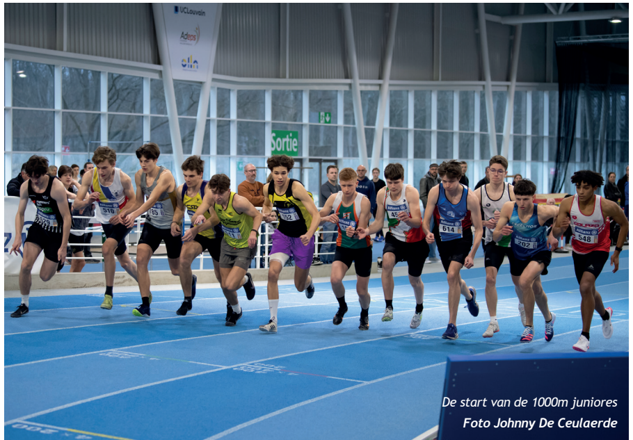
De start van de 1000m juniores