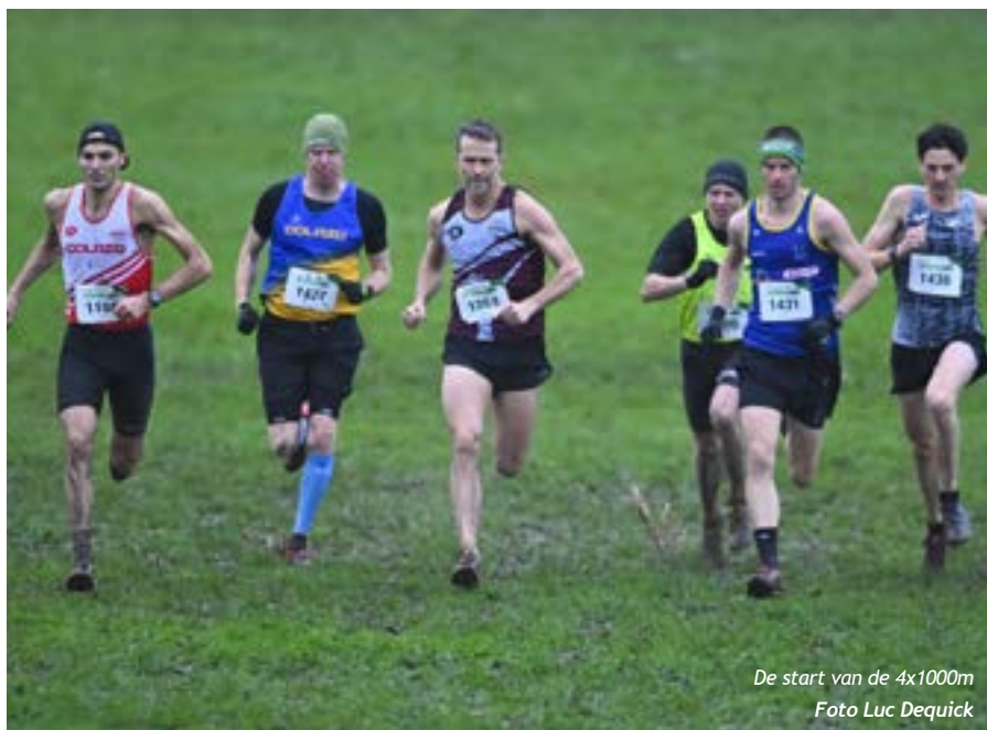
De start van de 4x1000m

Vlaamse Atletiekliga vzw @letiekleven 58 - Dinsdag 12 december 2023