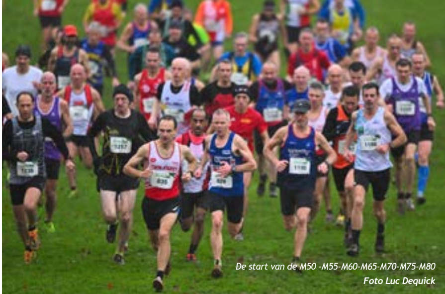
De start van de M50 -M55-M60-M65-M70-M75-M80

De regen herschiep het heuvelachtige parcours in het Park van Laken in een onvervalste moddercross. Maar de masters genoten er met volle teugen van om daags voor het EK veldlopen hun modderbad te nemen. Bij de jongste masters (W/M35) 'ploegerden' Kim Ruell en Karen Van Proeyen het snelst door het slijk. Zo kregen we op de dubbele erelijst van 2023 twee kleppers die in het niet zo ver verleden nog schitterden bij de seniores.