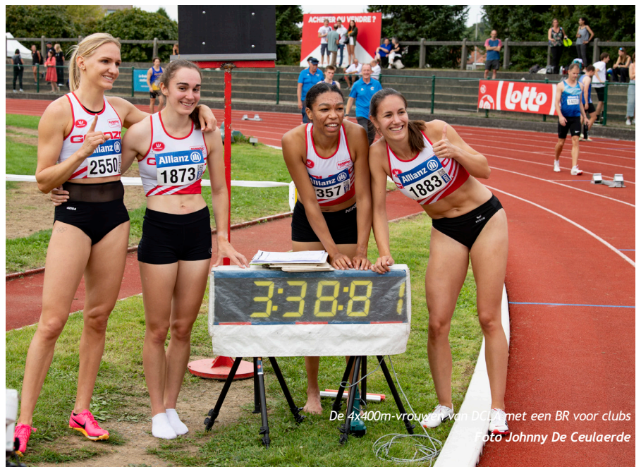
De 4x400m-vrouwen van DCLA met een BR voor clubs

Op de 4x400m voor mannen is RESC een vaste waarde op het podium en doorgaans ook op het hoogste trapje. Dit jaar kwamen ze andermaal met een topploeg aan de start,