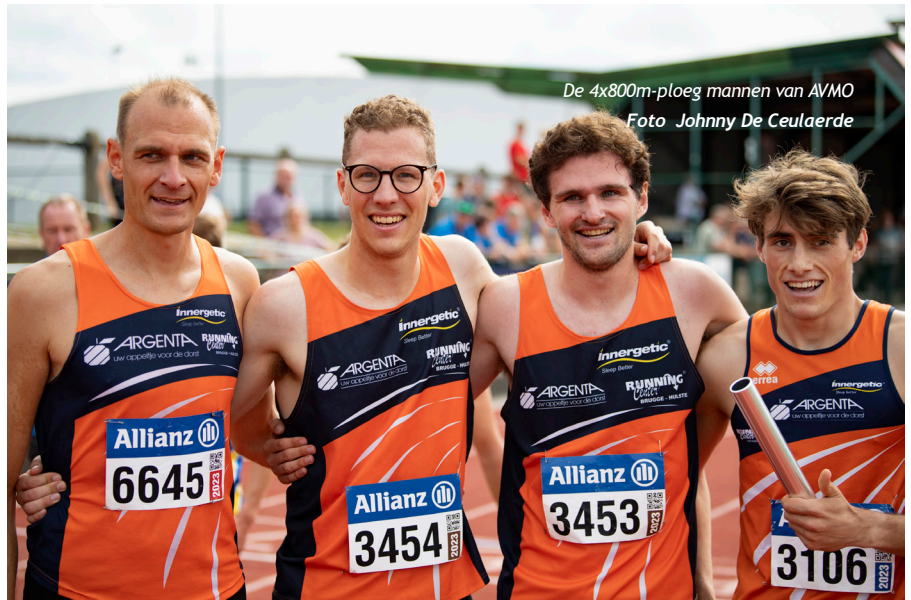
De 4x800m-ploeg mannen van AVMO

Hanne: "De club had een hele tijd geleden