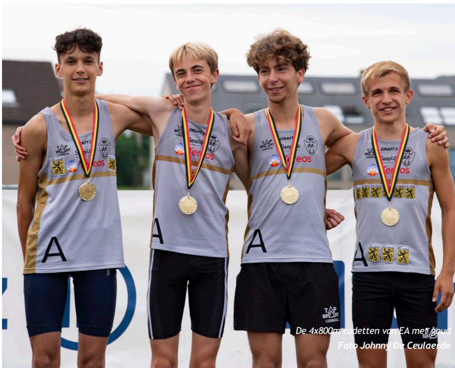
De 4x800m eddetten van EA met goud

Jonas: "We wisten dan we kans maakten op de titel, want we hadden een sterke