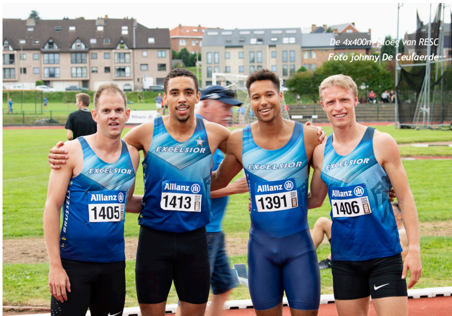
De 4x400m ploeg van RESC

Robbe: “De tijd kon beter, omdat niet alle wissels niet super gingen. In de reeks was het al nipt tussen Oscar en mij, dus in de finale nam ik een voetje minder. Maar het is gelukt en daar draait het om.”