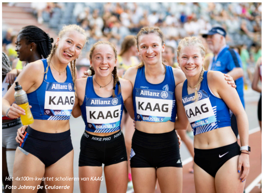
Het 4x100m-kwartet scholieren van KAAG

raapt, maar won alsnog in 2'28"10. Daarmee doet hij beter dan onder meer Eliott Crestan/SMAC op die leeftijd, en komt hij de top tien aller tijden binnen. Gauthier Walcarius/JSMC was tweede in 2'29"07. CABW was heer en meester in de 4x100