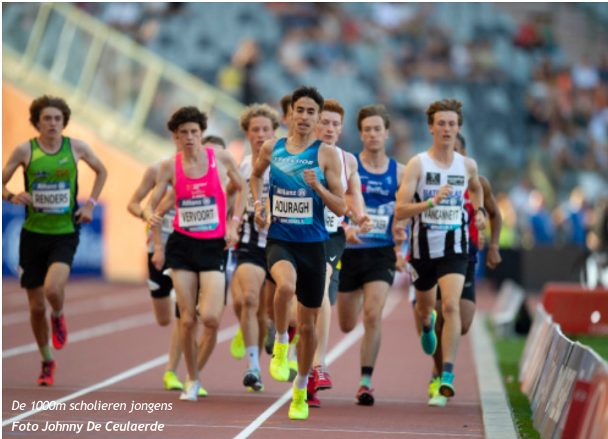
De 1000m scholieren jongens