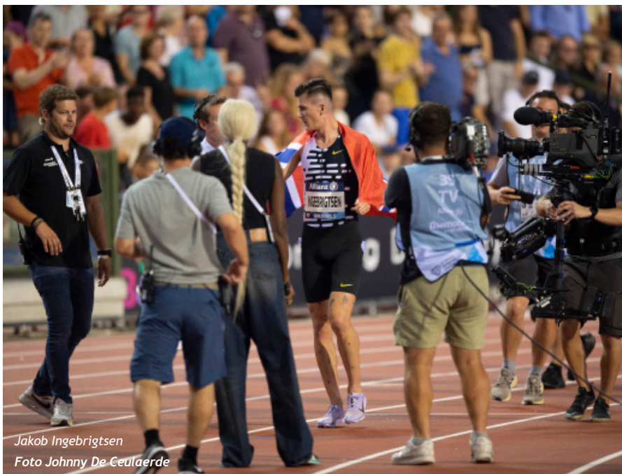
Jakob Ingebrigtsen

Jakob Ingebrigtsen/NOR (winst 2.000m in WR van 4'43"13): "Het is altijd wel leuk om een wereldrecord te lopen. Ik wist dat ik het kon, maar op het WK tien dagen ge-