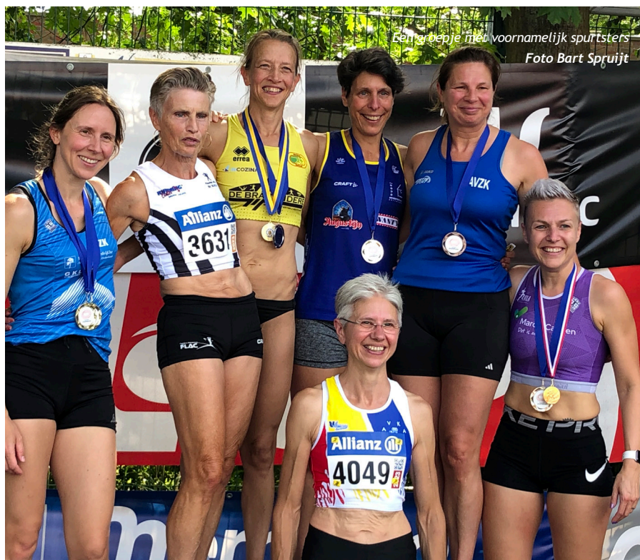
Een groepje met voornamelijk sprintsters

Niets uit deze uitgave mag worden vermenigvuldigd en/of openbaar worden gemaakt door middel van druk, website, mail, fotokopie of op welke wijze ook, zonder voorafgaandelijke toestemming van de uitgever. Teksten en foto's blijven eigendom van de auteur en fotograaf.