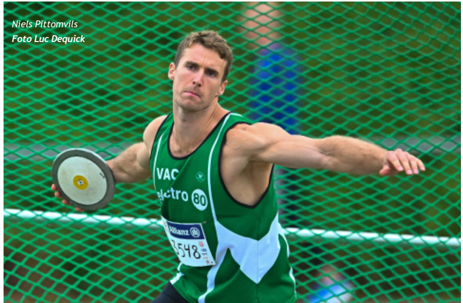
Niels Pittomvils

Aurèle Vandeputte/HAC was de snelste Belg in de 1.500 meter in 3'41"97, maar de aandacht ging vooral naar Stijn Baeten/DCLA. Die liep in eigen club zijn allertlaatste wedstrijd. Een mooie carrière met verschillende nationale titels, internationale selecties en zelfs een medaille op het EK veldlopen komt zo ten einde. Stijn eindigde zijn laatste race in 3'44"97. De 3.000 meter ging razendsnel en werd uiteindelijk gewonnen door de Amerikaan Cole Hocker in een straffe 7'42"93. Hocker loopt binnenkort het WK in Boedapest over 1.500 meter en wordt door in de finale verwacht. Clément Deflandre/HERV was de beste Belg met een persoonlijk record van 8'03"13.