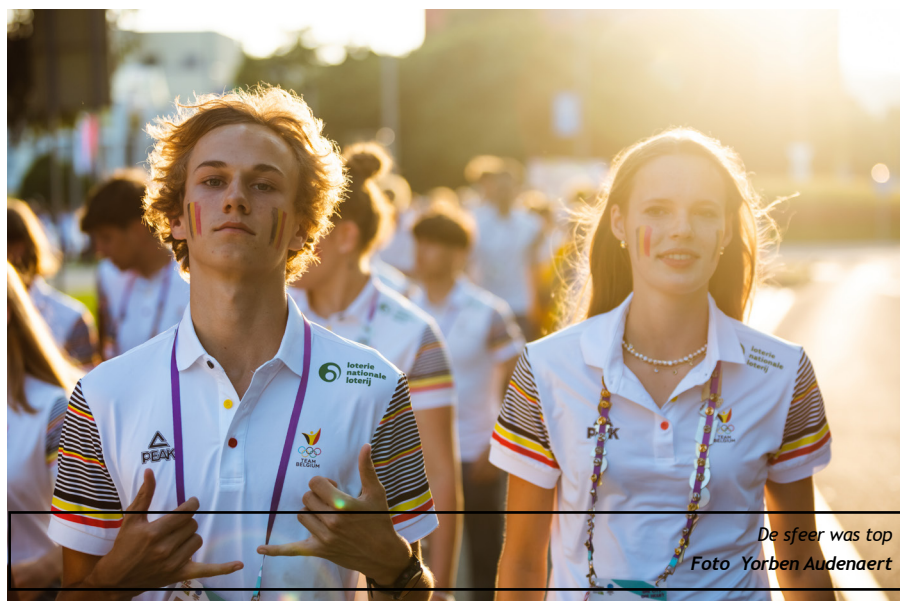
De sfeer was top

twee keer een persoonlijk record gegooid. Dat had ik zelf niet helemaal verwacht. In de finale kwam er niet echt de prestatie uit waarop ik had gehoopt. De stress speelde me opnieuw wat parten. Maar ik was wel blij dat ik in de finale stond. Ik heb nog geprobeerd om opnieuw een PR te gooien, maar dat is niet gelukt. Het was nog maar mijn eerste internationale kampioenschap. Ik kijk vooral uit naar de volgende kampioenschappen."