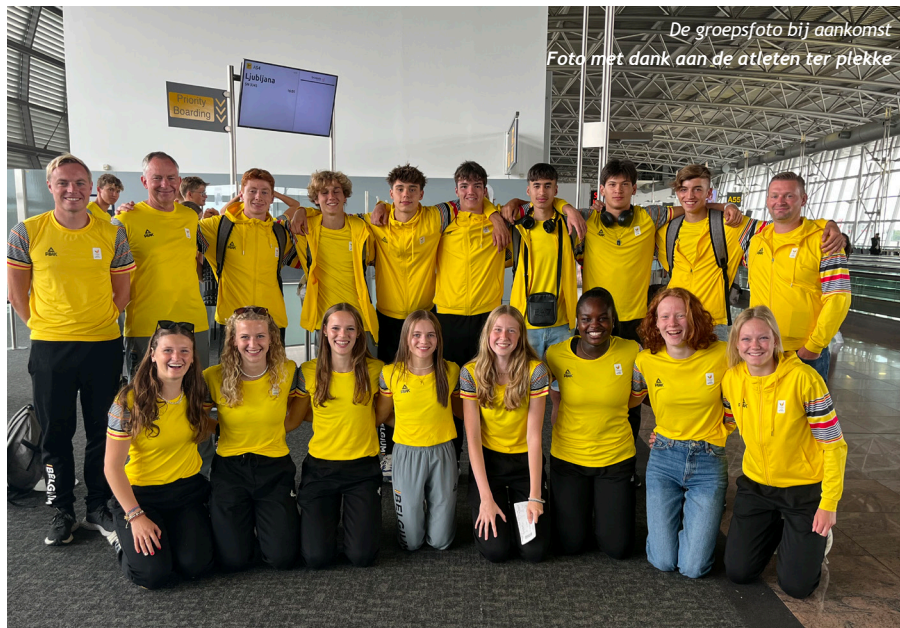
De groepsfoto bij aankomst