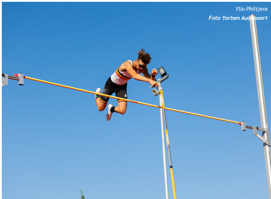
Yljo Philtjens

Astrid Van Breedam/AVLL had zich op het nippertje gekwalificeerd voor de 2000m