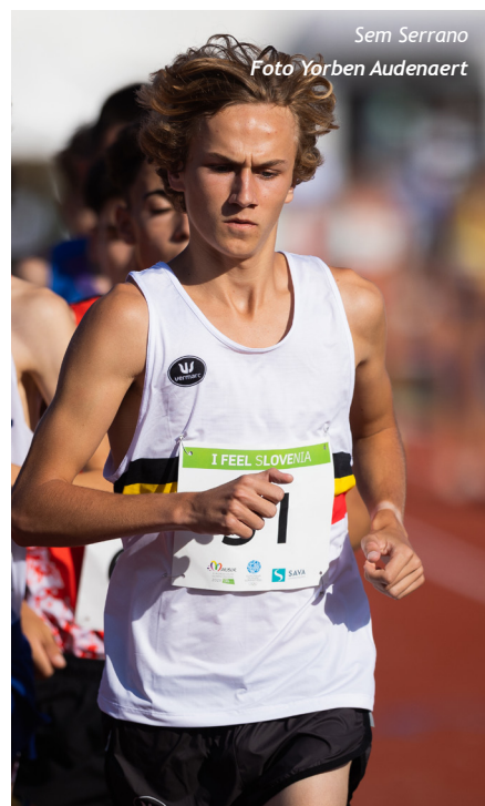
Sem Serrano