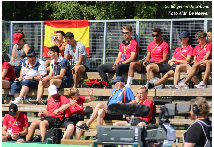
De Belgen in de tribune

wil ik graag de punten die ik liet liggen ophalen."