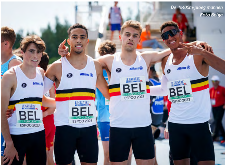
De 4x400m-ploeg mannen

In de 3000m steeple-finale liep Clément Labar een verstandige koers. Hij nestelde zich goed in het pak en toen hij de laatste ronde zijn turbo aanzette won hij nog een paar plekjes. Achtste in 8'47"38 was het eindverdict.