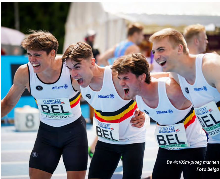
De 4x100m-ploeg mannen