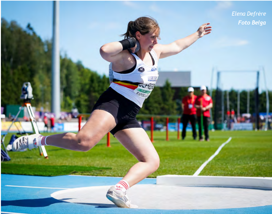
Elena Defrère Foto Belga