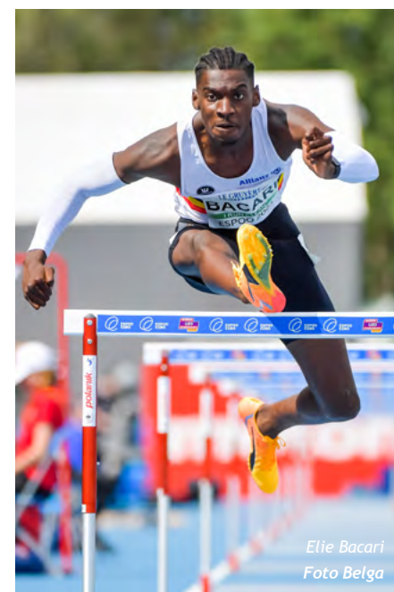
Elie Bacari