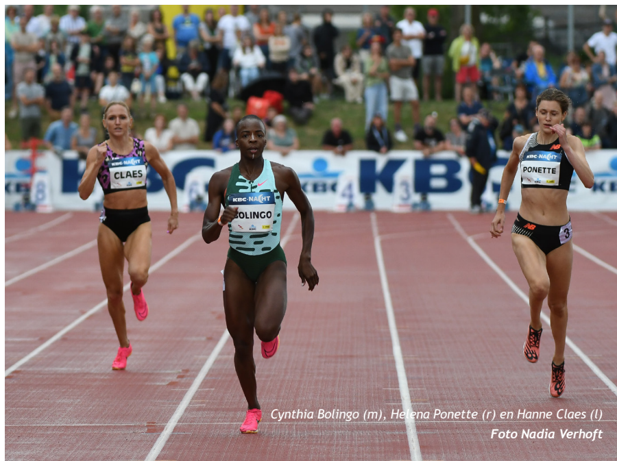
Cynthia Bolingo (m), Helena Ponette (r) en Hanne Claes (l)