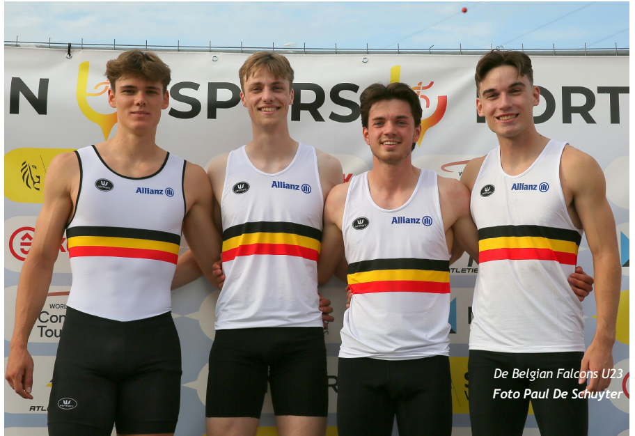
De Belgian Falcons U23

beseft ook dat het niet elke keer feest kan zijn. Ik mag ook niet vergeten dat ik deze winter een zware blessure heb gehad. Er zit zeker nog marge op en ik heb er vertrouwen in dat ik elke week opnieuw wat sneller ga lopen."