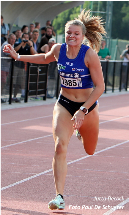
Jutta Decock

Kobe Vlemingcx/AVLL (100m in 10"39): "De eerste tien meter waren ok, maar daarna miste ik vooral frisheid. Ik ben niet super tevreden met deze chrono, maar ik