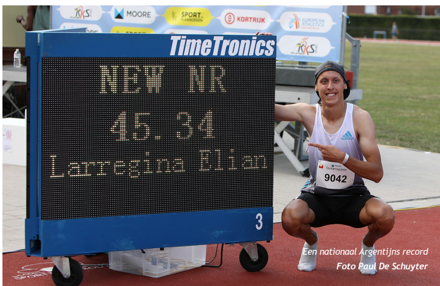
Een nationaal Argentijns record