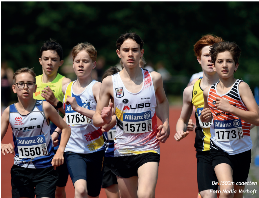
De 1500m cadetten