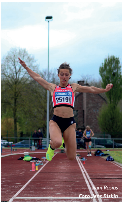
Rani Rosius

Op de achterkant van haar shirt prijken al heel wat provinciale schildjes, in Sint-Truiden deed cadet Hélène Deckers er daar nog eens drie bij: 12.27 (100m), 25.42 (200m, wind +2,2m) en een persoonlijk record van 11.97 in de 80m horden. Maxime Voorter/GENK vocht in de 800m een mooi duel met Lio Ramaekers/LOOI uit en won op de tweede dag met een straat voorsprong ook goud in de 1500m. Met respectievelijk 2.27.44 en 5.02.39 smukte ze haar kampioenschap met twee persoonlijke records op. Yamina Fontaine/AVT debuteerde in de 300m horden en zette met 49.39 de snelste tijd van de twee reeksen neer. Lien Swinnen/ATLA boekte met 32m27 discus en 10m26 kogel een dubbelslag in de werpnummers. Phebe Nicolaj/ACA was in het speerwerpen iedereen de baas met 27m21. In het hinkstap bezette ADD het volledige podium. Met een persoonlijk record van 9m39 hield ze nipt Inthe Daniëls (9m34) af. In het verspringen jumppte Soraya Paredes/LOOI als enige voorbij de vijf meter. Met 5m04 mocht ook zij een persoonlijk record bijschrijven.