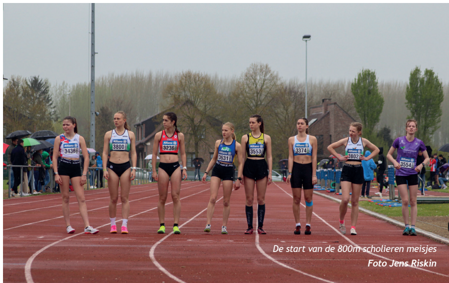
De start van de 800m scholieren meisjes

Na de Limburgse veldloopkampioenschappen in januari was TACT Sint-Truiden ook gastheer voor de provinciale pistekampioenschappen. Die verliepen met regenvlagen en een koude wind in niet al te beste weersomstandigheden. Een te forse rugwind blies tal van mooie spurtchrono's en springprestaties dan ook recht de prullenmand in. Ondanks die ongunstige omstandigheden kwamen er zo vroeg in het nog prille baanseizoen toch heel wat veelbelovende resultaten op het scorebord en blonken veel atleten met meer dan één titel op het erepodium.