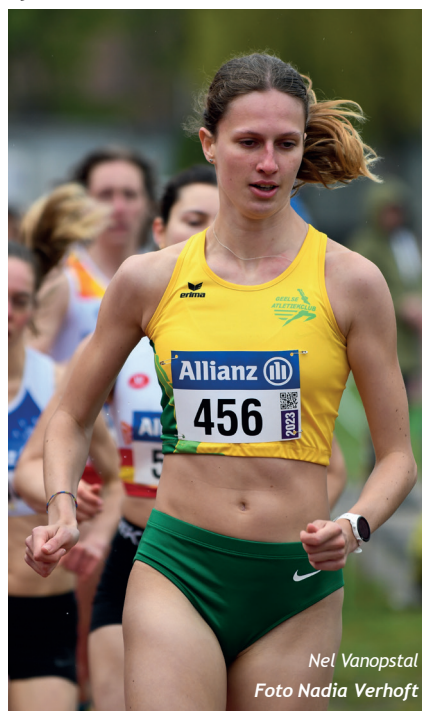
Nel Vanopstal