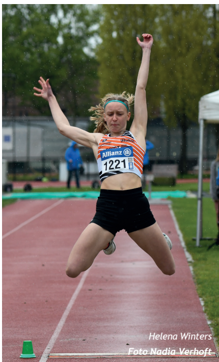
Helena Winters

Jim Van Bael/TUAC (cadet, goud 100m, 200m en 400m): “Het PR aanscherpen was het grote doel in de 100m maar met de stevige wind was dat geen evidentie. De tribune beschermde ons wel wat maar met -1,8m/s in de finale werden we toch gehinderd. Daarom dat ik zo verwonderd ben om hier 11”60 te klokken. Mijn start was nochtans niet super maar het tweede deel van de race voelde ik me super. Bij iets betere weersomstandigheden denk ik om onder de 11”50 te kunnen duiken.”