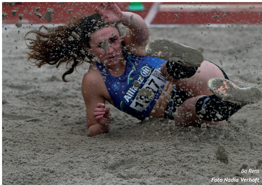
Bo Rens

Veel atleten toonden zich alvast multidisciplinair en wonnen dan ook de titel in verschillende atletiekonderdelen. Zo combineerde scholier Tuur Lambrechts/GEEL het speerwerpen met het hink-stap-springen. De Geelse atleet leek in het werpnummer lang te zullen strijden met Ben Vander Avert/KAPE maar haalde plots verschroeiend uit met 62m25. Ook Ben verbeterde zich en heeft nu 56m94 als PR. Cadet Siebe Bos/ACHL klopte op de eerste dag Senne Rombaut/SPBO (43"29) in de 300mH met 42"19 en haalde een dag later twee werptitels. In het kogelstoten pakte hij in zijn laatste worp uit met 12m37 en met de discus werd het een knappe 43m00. Senne Van Gelder/ACHL won het speerwerpduel van Devlin Neyens/VMOL bij de juniore met 55m26 tegenover 54m46 maar moest daarna forfait geven voor de 110mH. Devlin pakte dan weer provinciaal goud in het hink-stap-springen met 12m90 en zou een dag later ook het hoogspringen winnen met 1m90. Met de discus haalde hij 44m25. Hij moest enkel Alexander Anthonissen/KAPE (49m54), die ook het kogelstoten met 16m80 op zijn naam schreef, voor zich dulden. Het spannendste kijkstuk in het hink-stap werd geleverd door scholieren Jenna Vermeulen/ZWAT en Osahajajie Okaka/BVAC. Pas in de vierde sprong kon Jenna de leiding nemen en verbeterde de 10m75