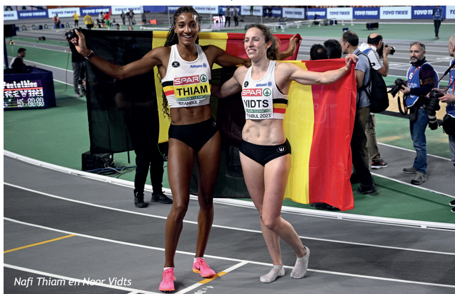
Nafi Thiam en Noor Vidts