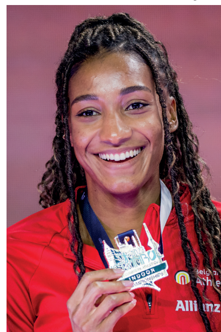
Cover: Nafi Thiam

ook heel lastig. Ik ben echt stomverbaasd, want ik dacht echt dat ik kon meespelen voor een plaats in de top vijf. Ik dacht zelfs dat een medaille mogelijk was. Misschien heb ik het lopen van twee wedstrijden na elkaar toch een beetje onderschat en ben ik onbewust toch heel vermoeid. Ik kan hier alleen maar uit leren en hard, maar het is toch een enorme teleurstelling."