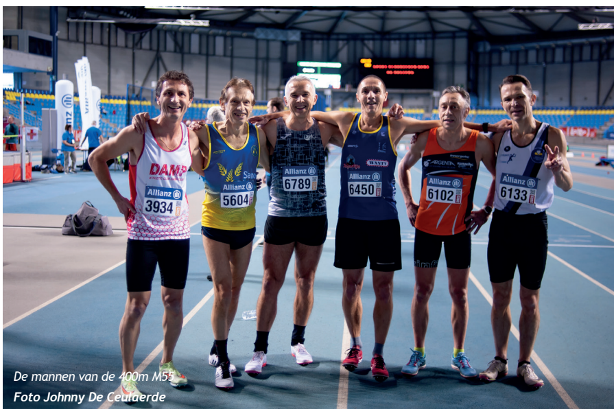
De mannen van de 400m M55