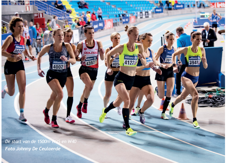
De start van de 1500m W35 en W40