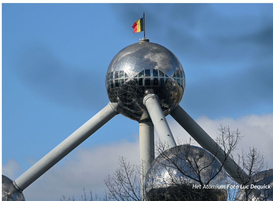
Het Atomium