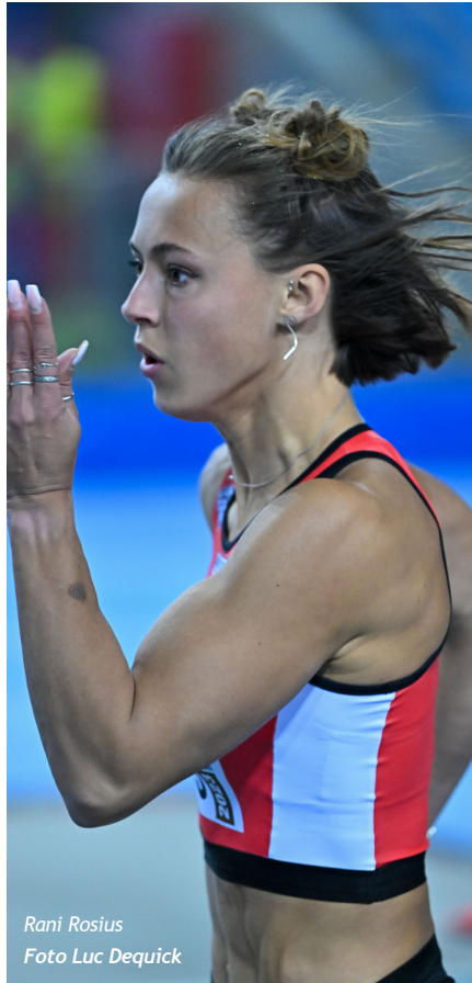
Rani Rosius

In het hoogspringen kregen we liefst acht vrouwen die sprongen op 1m71. Voor drie van hen werd dat het eindstation, terwijl Merel Maes/ACW haar competitie opende op die hoogte. Na een geslaagde sprong over 1m79 had Maes al zekerheid over de titel en ging ze solo verder. Op 1m85 had ze voor het eerst extra pogingen nodig, maar bij haar derde beurt klaarde ze ook die hoogte. Nadien bleek 1m88 net te hoog gegrepen. Het zilver was voor Yorunn Ligneel/HAC met 1m77 en het brons werd gedeeld door Zita Goossens/DEIN en Svea Van Laere/AVLO met 1m74. In het hink-stap-springen mochten we ons opmaken voor een duel tussen Margot Delbare/AVT en Jolijn Verhaeghe/HAC. Het was Delbare die de beste start nam en een consistent parcours aflegde met 11m78 als beste afstand. Verhaeghe kende een moeilijke dag, maar liet alsnog een mooie 11m64 opmeten. Het bleek vol-