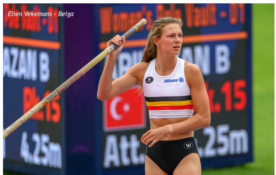
Elien Vekemans - Belga

Voor aanvang van de slotdag was al duidelijk dat het behoud héél lastig zou worden. De Belgische atleten zouden boven zichzelf moeten uitstijgen. Thomas Carmoy/CRAC gaf alvast het goede voorbeeld door in het hoogspringen zijn persoonlijk record bij te stellen naar 2m29. Het le-