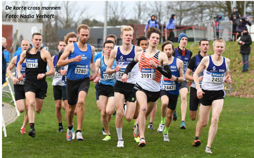
De korte cross mannen