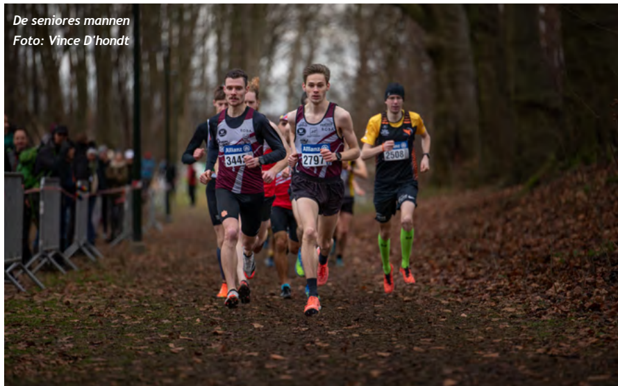
De seniores mannen