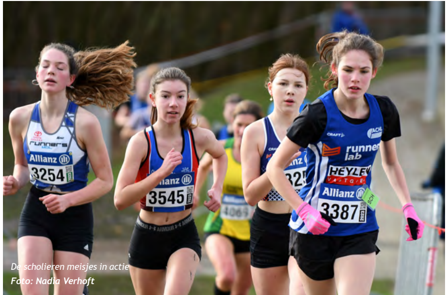
De scholieren meisjes in actie

Elke Godden/AVKA (winst seniores vrouwen): “Het gaat heel goed dit seizoen. Sinds maart vorig jaar ben ik aan het trainen zonder blessures. Ik heb nu ook een mental coach. Die heeft me heel goed geholpen om met wedstrijdstress om te gaan. Een tech-