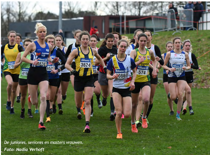
De juniore, seniores en masters vrouwen.

de finish en mocht het goud bij de eerstejaars in ontvangst nemen.